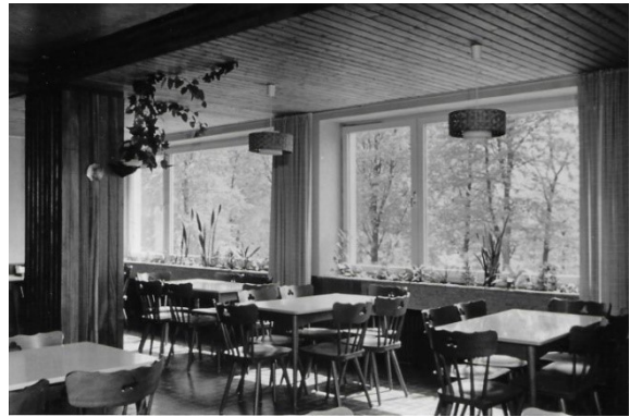
Schon früher zog es viele Schulklassen nach Winterberg – nicht nur zum Ski fahren.