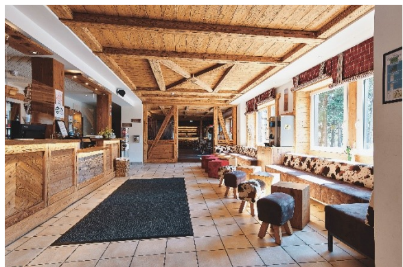
Hell und modern präsentiert sich Jugendherberge Winterberg heute.