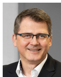
Fjedor Schieblon eko: Einkaufskooperation GmbH & Co. KG