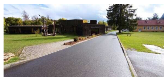
Hauptgebäude Haus NAKUNDU – Teil A