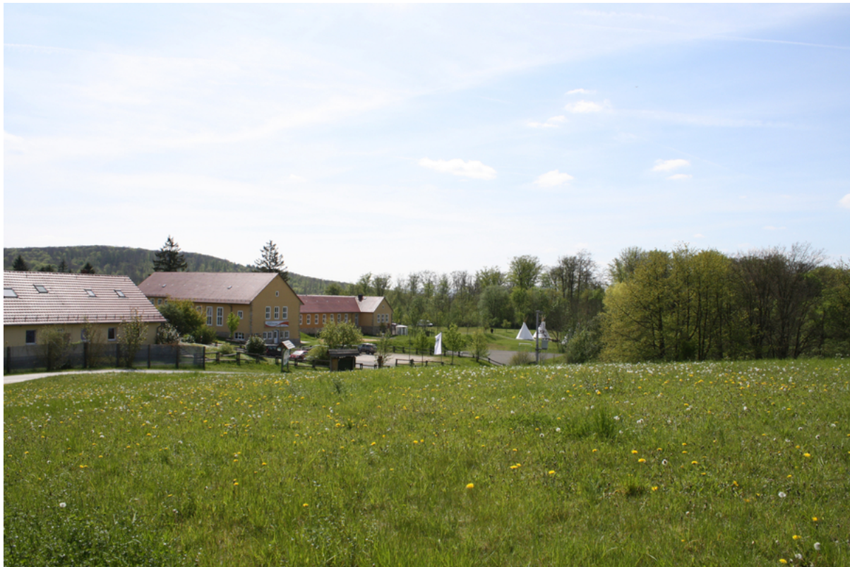
Jugendherberge Lauterbach – Urwald-Life-Camp