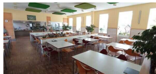
Speiseraum im Hauptgebäude – Teil B