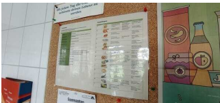
Information zu Allergenen und Zusatzstoffen