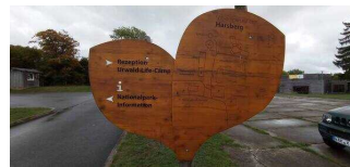
Wegweiser auf dem Gelände