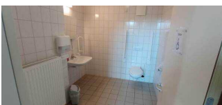
WC für Menschen mit Behinderungen im Hauptgebäude – Teil B