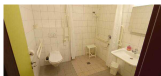
Sanitärraum 26 Fuchsbau Hauptgebäude Haus NAKUNDU – Teil B