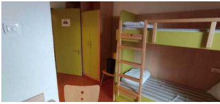
Zimmer 26 Fuchsbau Hauptgebäude Haus NAKUNDU – Teil B