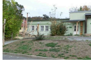
Ausstellungsgebäude Nationalpark Hainich