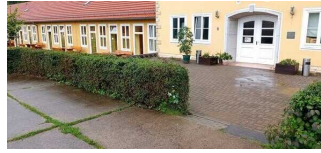
Eingang Hauptgebäude – Teil A