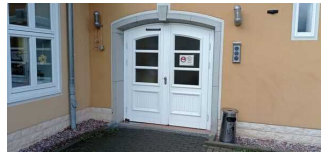
Seiteneingang Hauptgebäude – Teil B