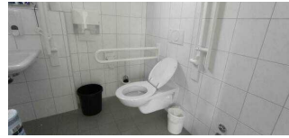
WC für Menschen mit Behinderungen Hauptgebäude Haus NAKUNDU – Teil A