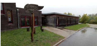
Hauptgebäude Haus NAKUNDU – Teil B