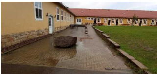
Seiteneingang Hauptgebäude – Teil B