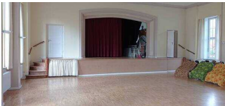
Veranstaltungsraum mit Bühne im Hauptgebäude – Teil A