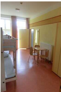
Zimmer 10 im Hauptgebäude – Teil B