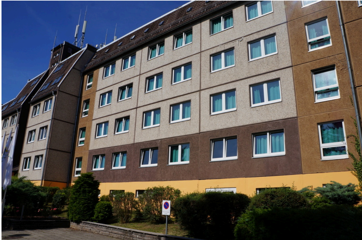
Jugendherberge Wernigerode