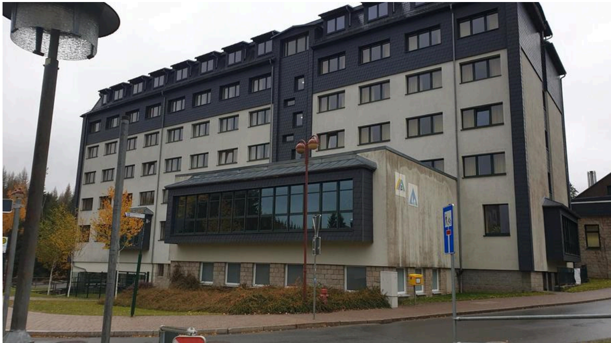
Jugendherberge Schierke