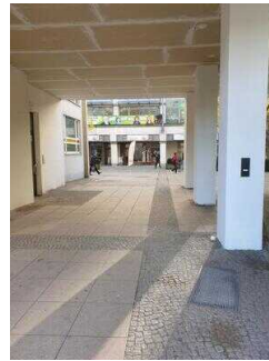
Weg vom Parkplatz zum Eingang