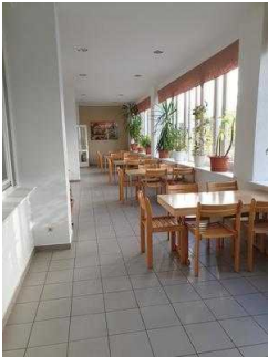
Jugendherberge Magdeburg – Cafeteria