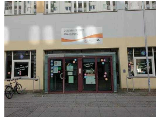
Jugendherberge Magdeburg – Eingang