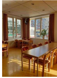
Jugendherberge Magdeburg – Tagungsraum