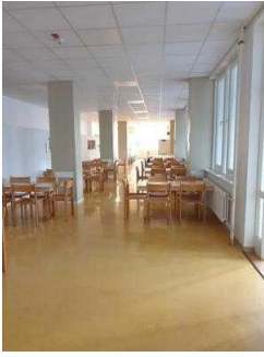
Jugendherberge Magdeburg – Speiseraum