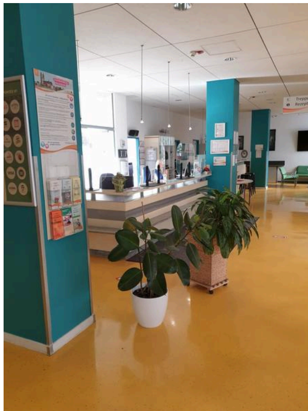
Jugendherberge Magdeburg – Rezeption