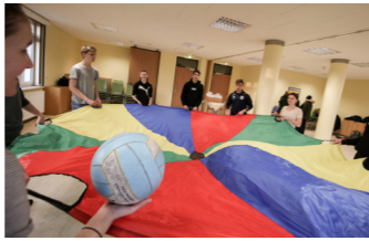
Seminarraum 1 & 2

* Auswahl: Fruchtquark mit Obstsalat / Vollkornschnittchen mit vegetarischen Aufstrichen / Smoothie / Apfel-Porridge im Glas und Obst / Gemüsesticks mit Kräuterquark und Obstsalat / gemischte Mini-Plunderstückchen oder Blechkuchen