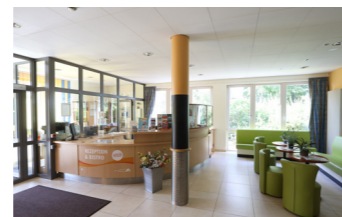
Rezeption mit kleiner Sitzzecke

* Auswahl: Fruchtquark mit Obstsalat / Vollkornschnitzchen mit vegetarischen Aufstrichen / Smoothie / Apfel-Porridge im Glas und Obst / Gemüsesticks mit Kräuterquark und Obstsalat / gemischte Mini-Plunderstückchen oder Blechkuchen