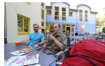
Terrassenbereich im Hof