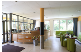
Rezeption mit kleiner Sitzcke

* Auswahl: Fruchtquark mit Obstsalat / Vollkornschnittchen mit vegetarischen Aufstrichen / Smoothie / Apfel-Porridge im Glas und Obst / Gemüsesticks mit Kräuterquark und Obstsalat / gemischte Mini-Plunderstückchen oder Blechkuchen