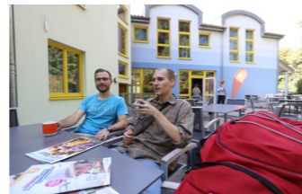
Terrassenbereich im Hof