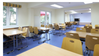
Seminarraum mit Terrassenzugang