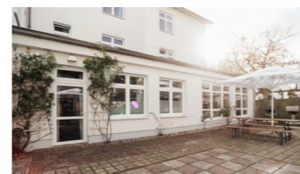
Innenhof mit Sitzmöglichkeiten und Grillecke