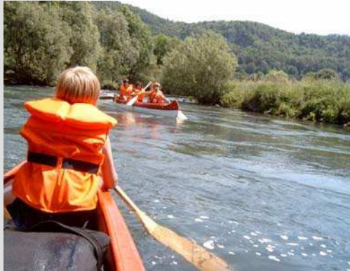
Unterwegs und aktiv in der Gruppe

Unmittelbar vor den Toren der Jugendherberge Hartenstein erstreckt sich die Hersbrucker Schweiz. Mit all ihren Abenteuern wartet sie darauf, von Euch entdeckt zu werden.